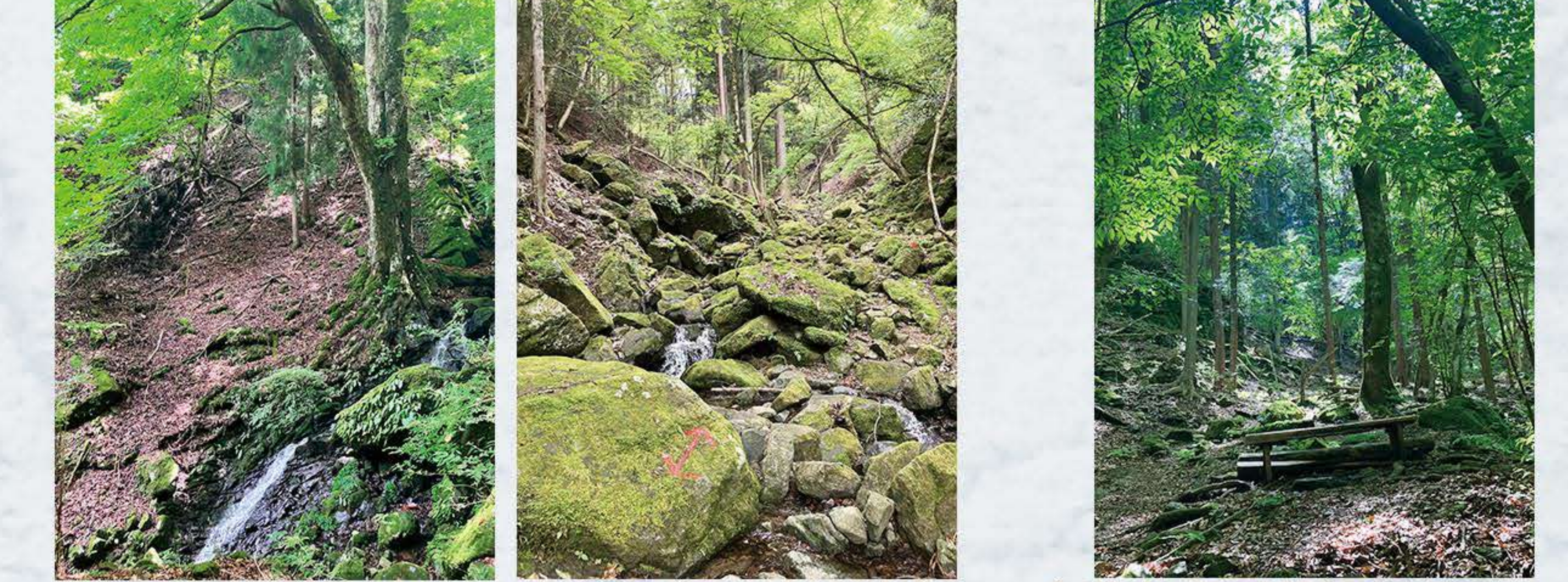
高畑山 オシノ沢 大トチノキとナメ滝、渡渉地点 倉岳山 月尾根沢 水源ベンチ

◆水源水場 (月尾根沢) 地図⑧ 登山者休憩用のベンチとテーブルが設置されています。山火事用水場で飲用検査はされておらず、現在は沢水がわずかに流れる程度です。