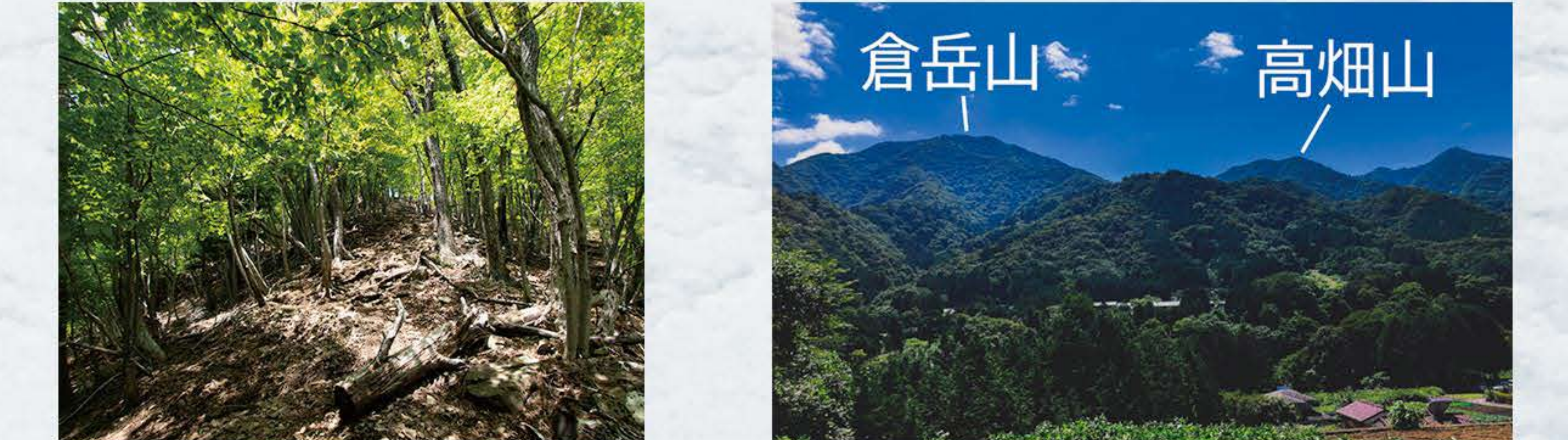
倉岳山山頂手前の急登 倉岳山・高畑山の山容

桂川の南側に連なる秋山山系の最高峰。登山口から水源水場まで苔むした沢治いの道が続き、初夏でも爽快です。広めの山頂はグループごと距離をおいての休憩ができます。 ▲山梨百名山 No.17