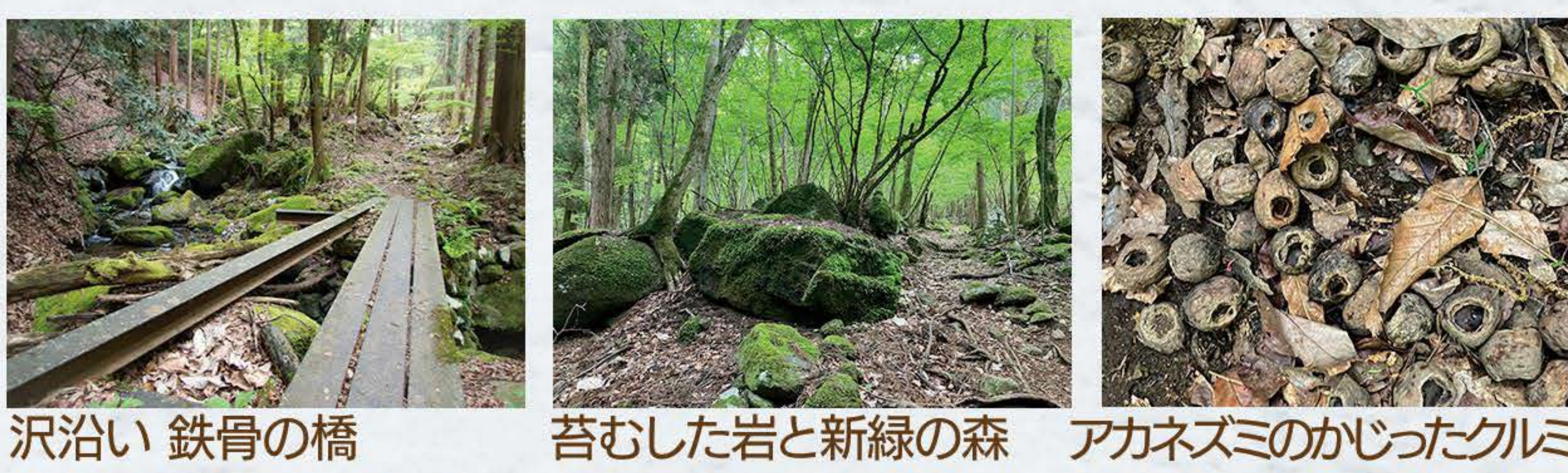
沢治い 鉄骨の橋 苔むした岩と新緑の森 アカネズミのかじったクルミ

◆小篠貯水池 オシノ沢を水源とする農業用水の溜め池（アースフィルダム）です。令和5年8月まで防災工事予定のため、周辺通行時ご注意ください。