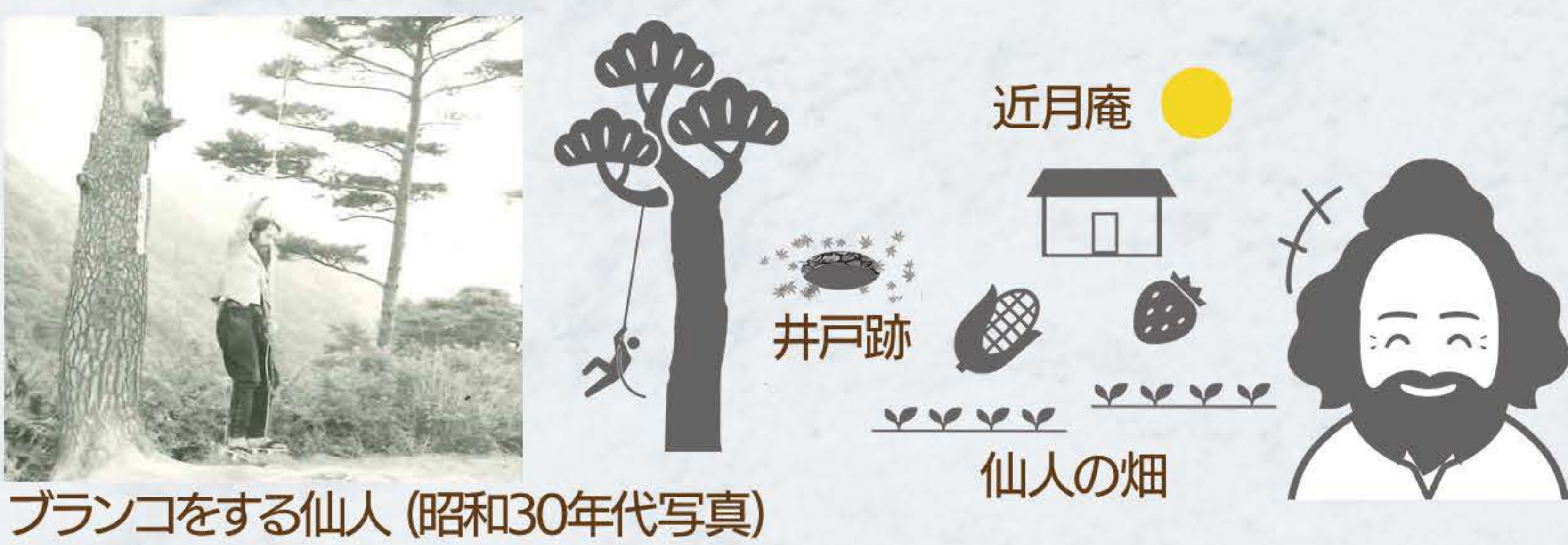
ブランコをする仙人 (昭和30年代写真) 仙人の畑

◆仙人小屋跡 戦後 高畑山中腹の開墾地跡に小屋(近月庵)を建てて住み、畑を耕したり句を読んで暮らし高畑山仙人と呼ばれた人物がいました。ほからかな人柄で、来訪者のため崖の大木に空中ブランコを作ったり、苺を育てたといひます。仙人小屋跡指導標脇の植林を通る道は尾根で行き止まりです。